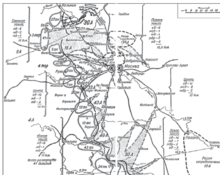
Рис. 1. Положение на Западном фронте 15 ноября 1941 г. и планы сторон 5

что ей удалось вырваться из окружения, значительная часть бронетехники была оставлена на поле боя 4 . Войска правого крыла Юго-Западного фронта с середины декабря выдвинулись на 80—100 км; войска центра Западного фронта освободили Наро-Фоминск, Боровск и Малоярославец. К исходу 16 декабря непосредственная угроза Москве была устранена.