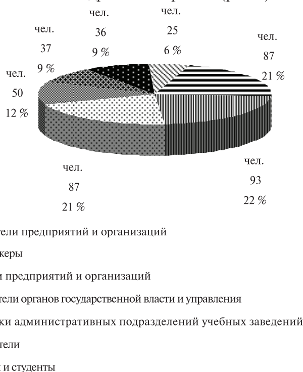
Рис. 2. Состав и структура участников летней школы в 2016—2018 гг.

В целом проект привлек 415 непосредственных участников, среди них: 37 HR-менеджеров компаний, 50 руководителей и 36 специалистов крупных и малых предприятий и организаций, 25 представителей органов государственных власти и управления (в том числе служб занятости), 93 педагога и 87 сотрудников административных подразделений вузов и ссузов, 87 студентов и аспирантов (рис. 2).